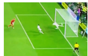
Il goal fantasma a Euro 2012 non accordato all'Ucraina nel match con l'Inghilterra

E come lui, l'assistente e ora anche il giudice di porta. Sembra impossibile, ma anche mettendo un uomo a pochi metri dalla porta, gli occhi piantati sulla linea, l'errore ci può stare. Palla dentro o fuori, fuori gioco o no, contatto dentro in area, oppure no: l'attimo è fugace. E noi siamo esseri umani, non automi.