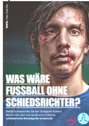
Cosa sarebbe il calcio senza arbitri? Campagna del Kickers Stoccarda 2010

Un ringraziamento alla Sezione disciplinare per il grande impegno nello svolgere le molte inchieste entro termini ragionevoli e per aver sempre garantito la tutela degli arbitri. E un infinito grazie a tutti questi nostri colleghi che, malgrado abbiano subito maltrattamenti intollerabili, non hanno mollato, proseguendo la loro attività con convinzione e tenacia. Bravi!