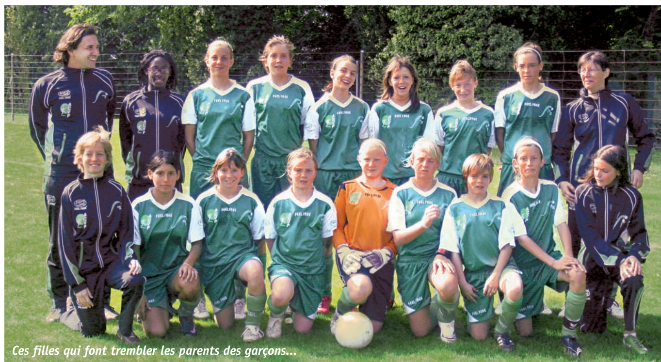
Ces filles qui font trembler les parents des garçons...