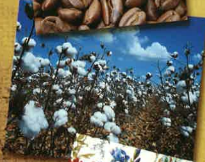
Baumwolle war dank billiger Sklavenarbeit auf den Plantagen in Übersee für uns Europäer preisgünstig zur Verfügung.