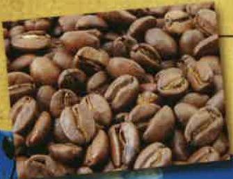
Kaffeebohnen, zu dieser Zeit meist angebaut und geerntet durch Sklavenhand.