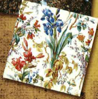
Feinste «Indienne»-Stoffe aus der Schweiz waren Zahlungsmittel zum Einkauf von Sklaven bei afrikanischen Unterhändlern und Lokalfürsten.