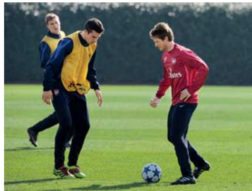
Im «1 gegen 1» mit Hollands Stürmerstar Robin van Persie.