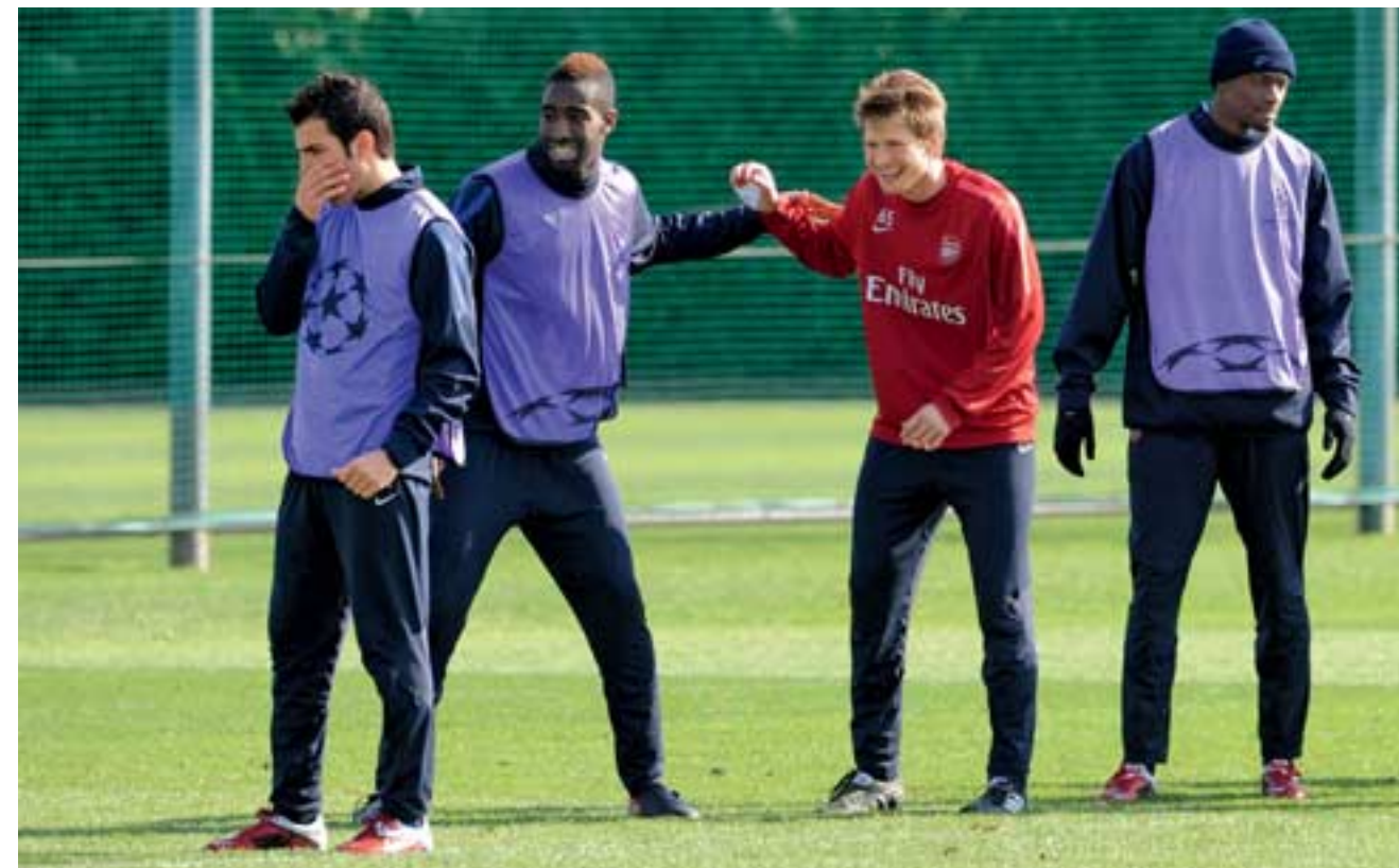
Zwei Schweizer Nationalspieler albern herum: Sead Hajrovic im Training mit Johan Djourou, wenige Tage vor dessen schwerer Schulterverletzung.