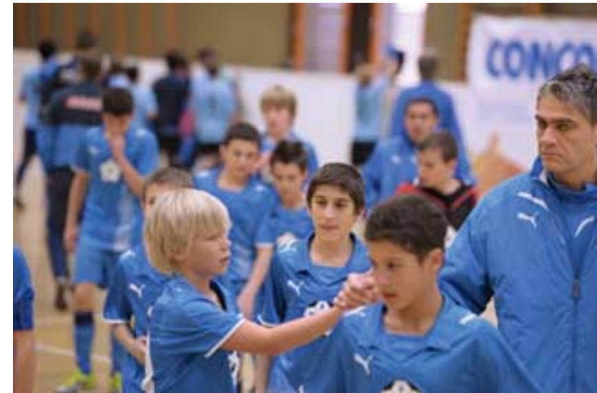
5. Platz am internationalen U13-Turnier in Triesen (FL)

Nach drei Trainings und einem Testspiel nahm die U13 in Olten am traditionellen U13 Regionalauswahlturnier teil.